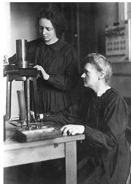
Figura 8. Marie y su hija Irène en el Instituto del Radio de París.

ciencia y cambiaba una gran parte de lo que se sabía de la antigua.